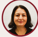
Yıldız Ayyıldız İlkokul Md.Yrd ÇÖKE Lideri